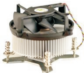
CF-520 Ventilador Pentium 4 Socket LGA775 de Altas Prestaciones (Suministro por separado)