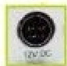
Single 12V Power Input