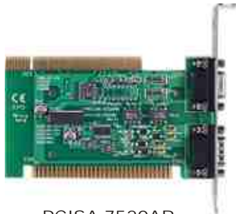
PCISA-7520AR Tarjeta ISA/PCI Convertidora RS-232 RS-422/485 Opcional